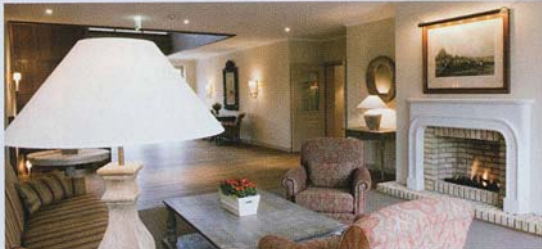
Lüdersburg: Stilvolles Innenleben