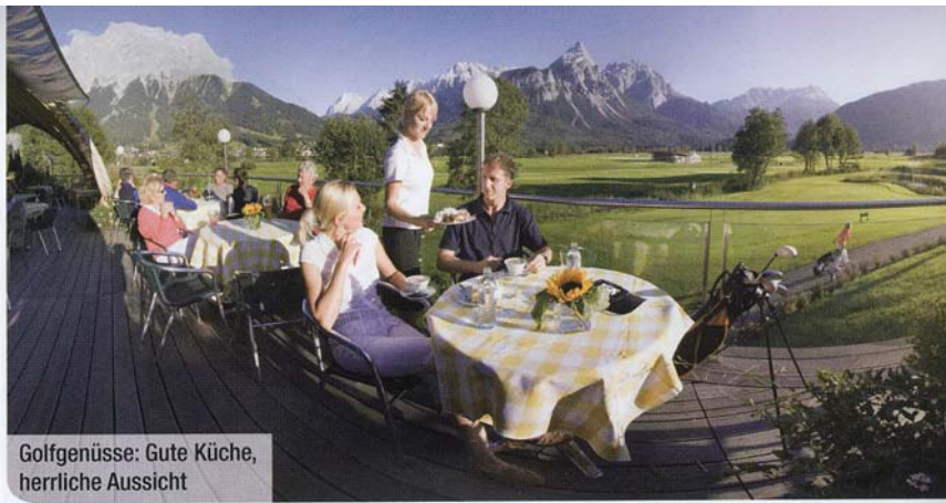
Golfgenüsse: Gute Küche, herrliche Aussicht

Die Turnierreihe geht ins zweite Jahr. Das Startturnier findet heuer auf dem traditionsreichen, parkähnlichen Gut Waldhof statt. Beim Finale am 9. Oktober im Maritim Golfpark Ostsee werden die Regionen Berlin und Hamburg gegeneinander antreten. Infos und Anmeldungen unter: www.hamburg-spielt-golf.de