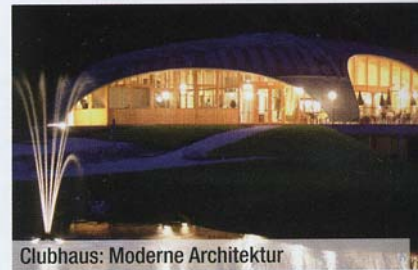
Clubhaus: Moderne Architektur

E r überzeugt durch großzügig angelegte Spielbahnen auf natürlichen Wiesen und ein herrliches Bergpanorama mit dem markanten Wettersteinmassiv und der Zugspitze, Deutschlands höchstem Berg. Anspruchsvolle Par-3-Bahnen wechseln sich mit leichten Par-4-Bahnen ab. Bei den Par-5-Bahnen, insbesondere der 9. Bahn, ist der Spieler auch in der Länge gefordert. Trainieren kann man auf der beleuchteten und beheizten Driving Range (Golf Academy mit erfahrenen PGA-Pros). Was ebenfalls gefällt: das Clubhaus mit seiner modernen Architektur, dem